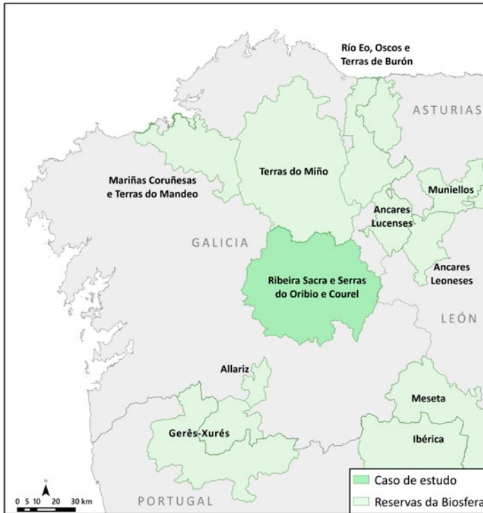
Figura 6. Reservas da Biosfera do noroeste da Península Ibérica