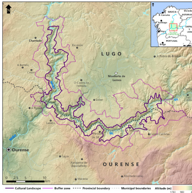
Figura 2. Mapa da proposta de BIC Ribeira Sacra (2017)