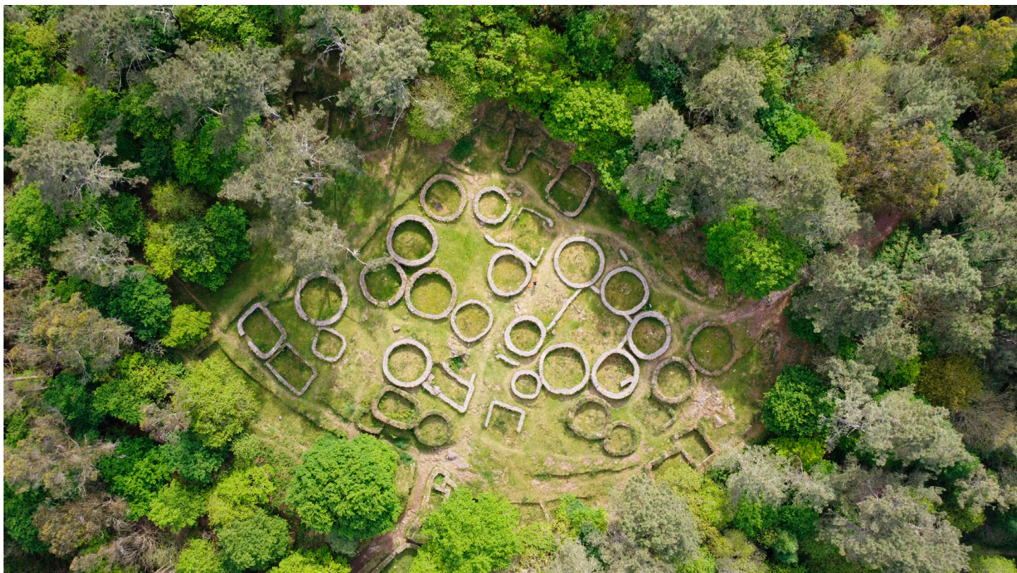
Fotografía aérea de dron do Castro de Borneiro (Cabana de Bergantiños)

A esta imaxe xeral poderíamos sumar a explotación frecuente doutros recursos naturais, como a pedra, para a construción das diferentes arquitecturas dos poboados; as arxilas, para a elaboración de cerámica, co traballo específico de oleiros locais que adquiriron gran destreza técnica, ou a madeira para o uso diario e construtivo. Por outra parte, sabemos tamén que a explotación de certos minerais para as actividades metalúrxicas, como cobre, estaño, ferro e ouro, ocupaban boa parte da vida dalgúns destas comunidades. Xa a partir do s. I, coa presenza romana, levántanse asentamentos especializados, orientados á extracción do ouro e á súa comercialización.