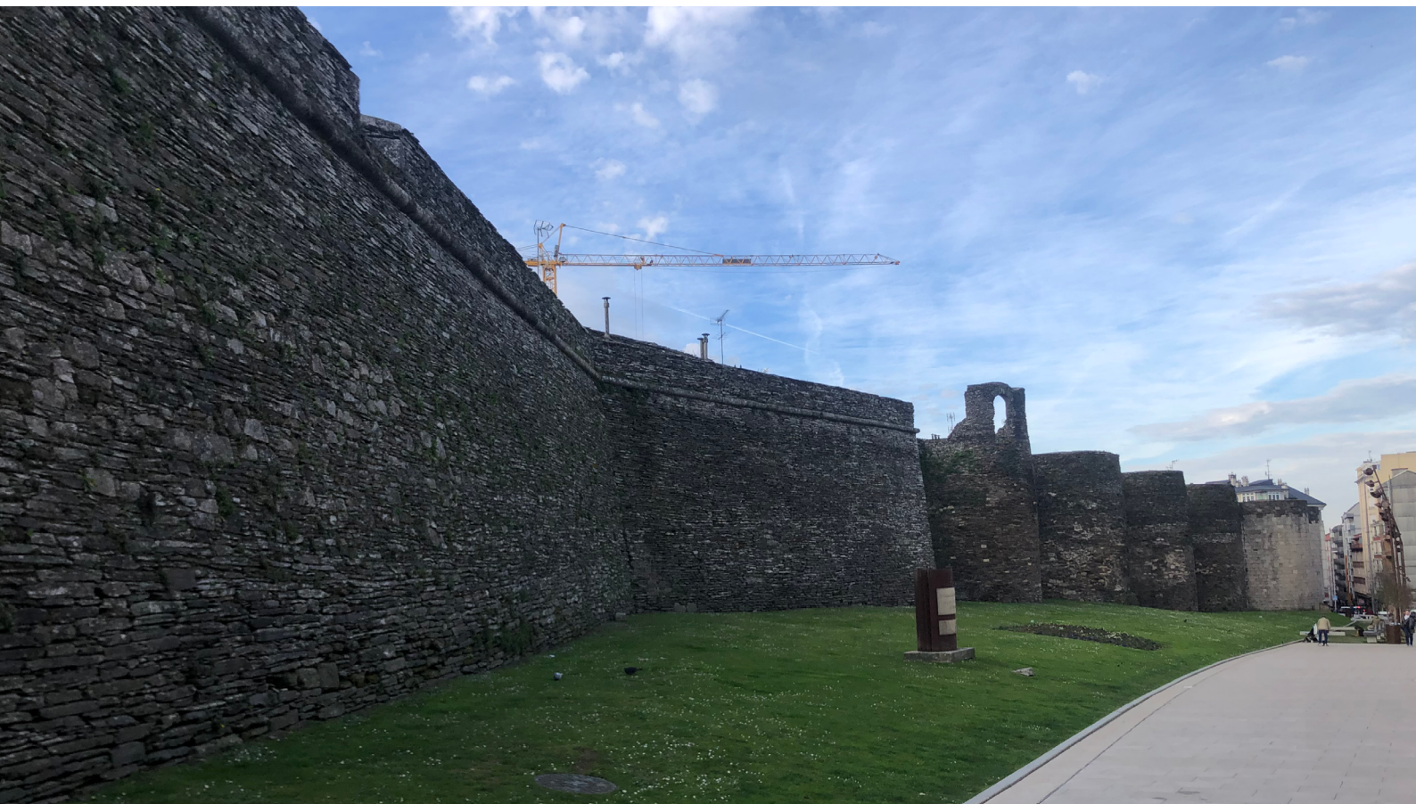
Muralla romana de Lugo

Gallaecia foi modificando o seu territorio baixo diversos mandatos imperiais. Segundo Dion Casio, a partir do ano 27 a. C. produciuse unha reestruturación das provincias hispánicas, pero o territorio do norte aínda non estaba