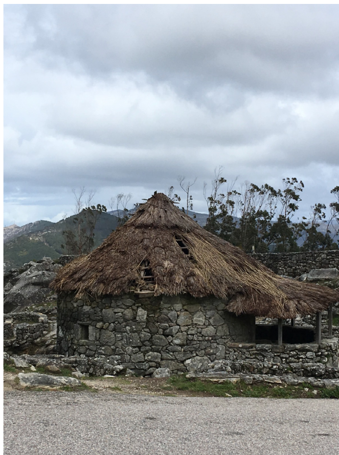
Fotografía dunha vivenda do Castro de Santa Trega (A Guarda)

A partir de mediados do primeiro milenio (s. V e, sobre todo, s. IV a. C.) comeza o período coñecido como II Idade do Ferro, na que o mundo castrexo sofre toda unha serie de transformacións cara a unha maior complexidade e xerarquización nas comunidades. Neste momento, a localización dos castros presenta máis diversidade nos emprazamentos, vales e áreas de media ladeira, proximidade de recursos económicos, como as terras fértiles, aínda que non parecen perder esa elección estratéxica en territorios con topografías elevadas. Estes recintos adoitan reflectir maior monumentalidade, con sistemas defensivos elaborados e murallas divididas. Os cambios obedecerían a un crecemento demográfico xeneralizado, que aumentaría a competitividade entre as comunidades e, en consecuencia, a necesidade de elementos defensivos de maior envergadura.