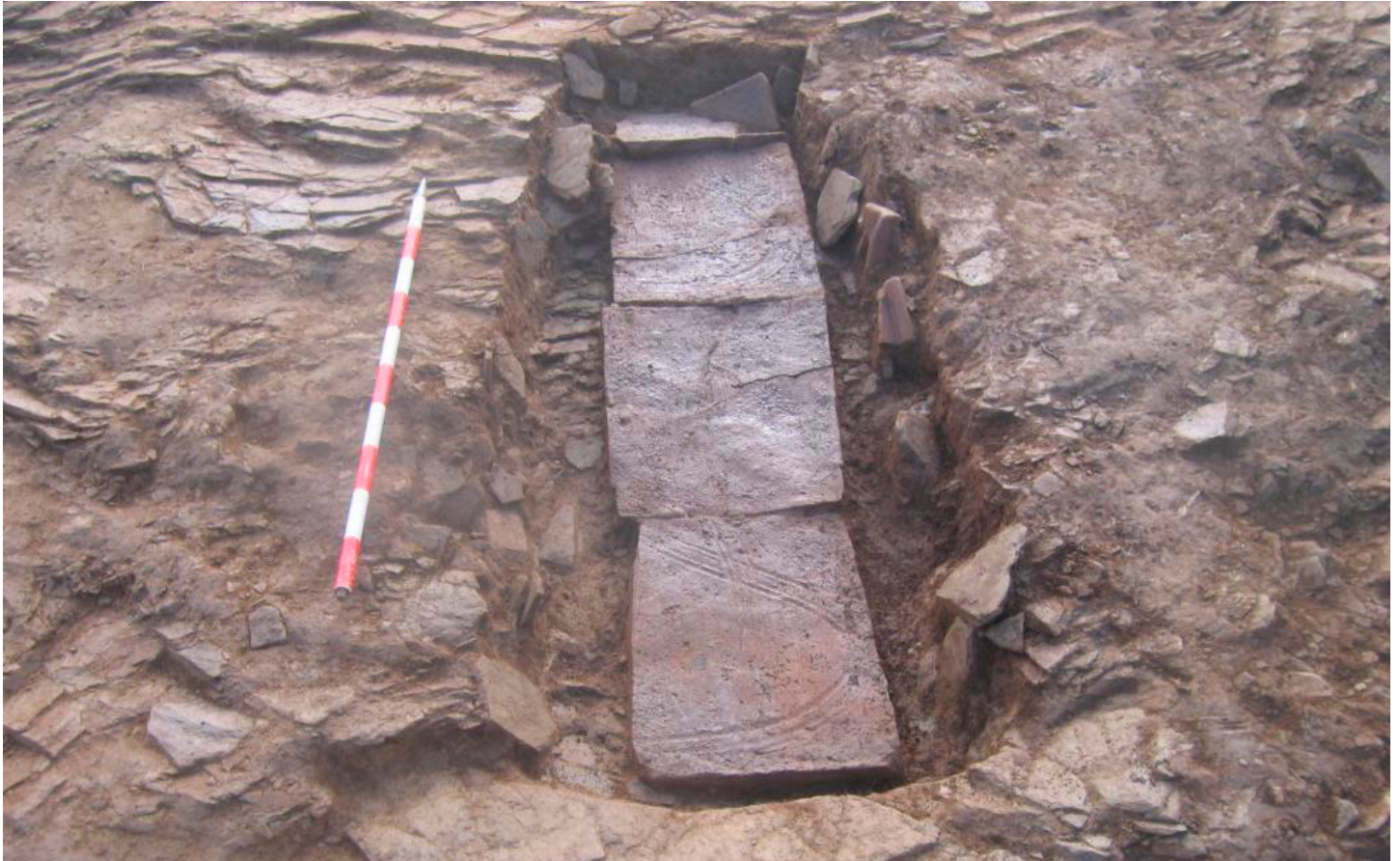
Fotografía dunha tumba romana da vila de Peneiro (Outeiro de Rei, Lugo)

peixe, que se elaboraba en factorías galaicas (das que conservamos bastantes exemplos, entre os máis destacados Noville, en Mugardos, ou O Areal, en Vigo). Esta conserva levou o peixe a lugares onde apenas era unha rareza. Hai dúbidas sobre o alcance da produción de viño, pero o seu consumo está ben testemuñado. Pola contra, moi escasa sería a presenza de aceite debido ao elevado prezo da súa importación.