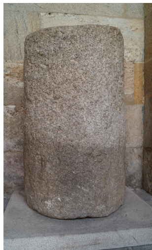
Fotografía do miliario dedicado ao emperador Caracalla no ano 213 d.C., procedente de Monterroso, Lugo (na actualidade atópase no atrio da Facultade de Xeografía e Historia, USC) Santiago de Compostela

mos de numerosos miliarios, grandes sinais de pedra para marcar as distancias entre os principais puntos da ruta. Como curiosidade, hai que comentar que Galicia é a rexión romana onde máis miliarios apareceron.