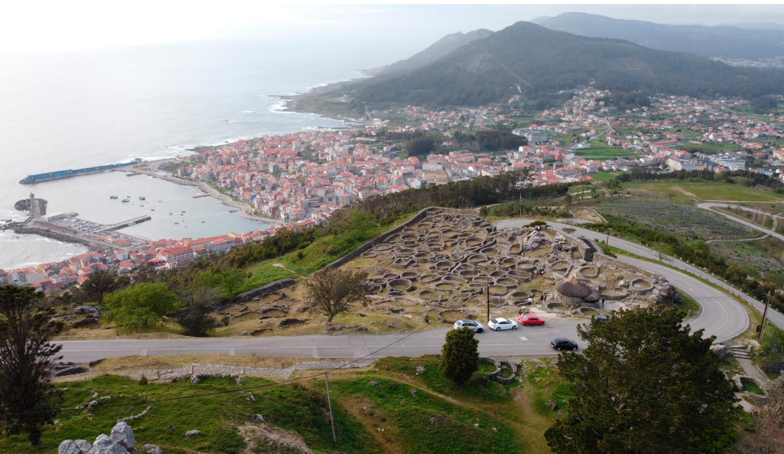
Fotografía aérea de dron do sector central do Castro de Santa Trega (A Guarda)

Sen lugar a dúbidas, o tempo dos castros é unha das etapas máis salientables da historia de Galicia. Ben sexa porque Galicia conserva varios miles de castros ou ben porque no acervo cultural galego a cultura castrexa ten adquirido unha relevancia senlleira, as paisaxes castrexas son únicas no contexto peninsular. Castros ben coñecidos como os de Baroña (Porto do Son), Viladonga (Lugo) ou Santa Trega (A Guarda), entre outros, continúan impresionando hoxe os visitantes como xa o facían no pasado.