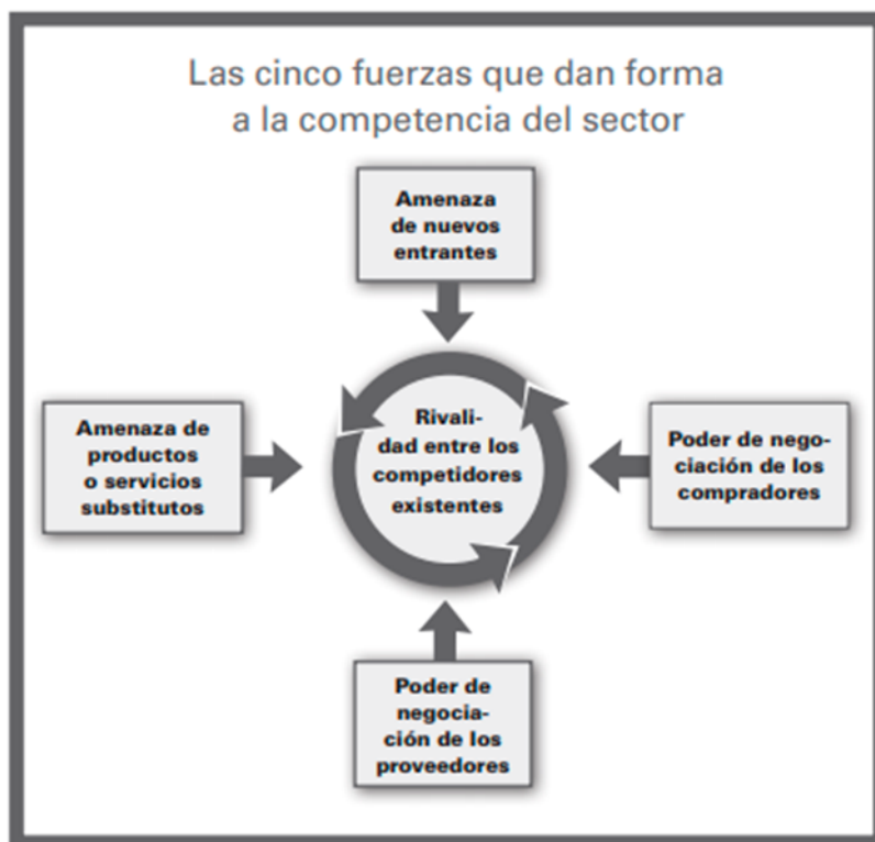
Figura 2. As cinco forzas que dan forma á competencia do sector

Michael E. Porter é un importante economista estadounidense que recibiu o premio Nobel de Economía en 2008. No seu traballo As cinco forzas competitivas que lle dan forma á estratexia , establece que é necesario defender á empresa das forzas competitivas e moldealas para o seu propio beneficio (Porter, 2008). Tamén di que as forzas competitivas máis fortes determinan a rendibilidade dun sector e transfórmanse nos elementos máis importantes da elaboración da estratexia.