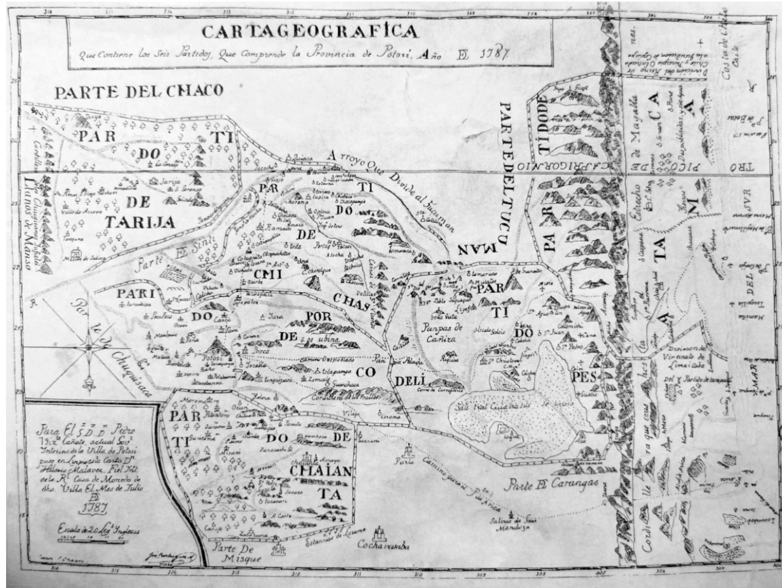
23. ACMP, M y P-141. Mapa Potosí 1787. Carta geográfica que contiene los seis partidos, que comprende la provincia de Potosí. Cañete, Pedro Vicente, La Papelera, La Paz, 10-nov. 1952.