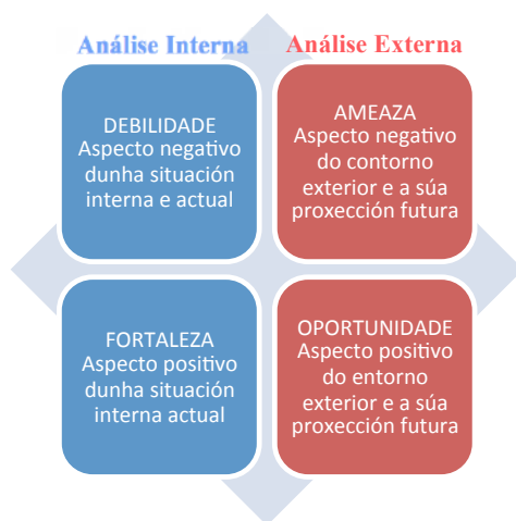
Figura 1: Tipos de análises

¿Cales son as mellores oportunidades que este lle brinda?