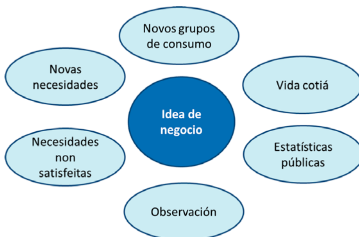
Figura 3. Orixe dunha idea de negocio